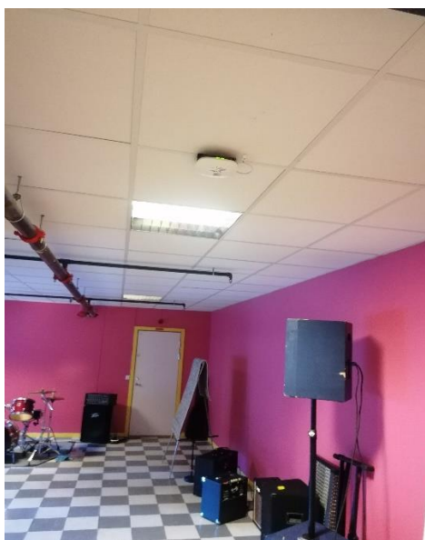
Intens remake av pre-prod på slutten av året 2022...